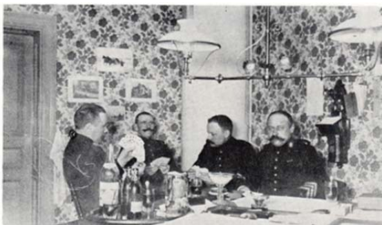
Bild 13. En stilla spader på underofficersmässan på Kungsholmen i början av 1900-talet.

Något elljus fanns inte, om man undantar ett litet aggregat för fortets enda strålkastare. Färskvatten transporterades varje vecka till ön med en liten tankbåt och pumpades till en brunn mitt i parken. Där fick de olika hushållen hämta sitt veckobehov.