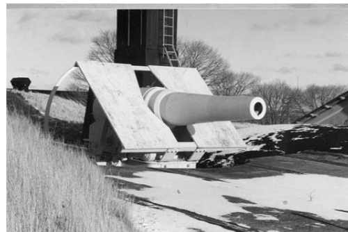
24 cm kanon m/1876

behövdes något annat skydd för på redan förankrade fartyg. Kungsholmsfort var för sin tid mycket kraftigt bestyckat. Vid seklets början bestod bestyckningen av tre