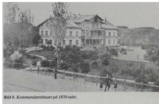
Bild 9. Kommandantshuset på 1870-talet.

sablar, men där fanns också spjut och andra mordvapen. Bemanningen av fortet