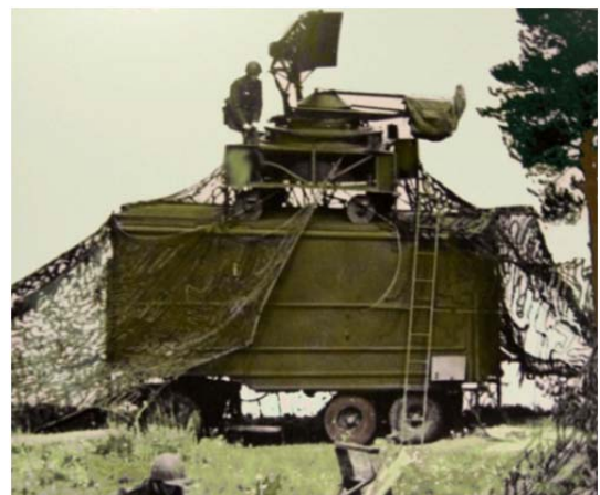
Grupperad PA 31

Lastterrängbil 936 K var vid bildandet av Museum för rörligt kustartilleri i mycket dåligt skick. Vissa delar t ex hjul och däck saknades men kunde återanskaffas.