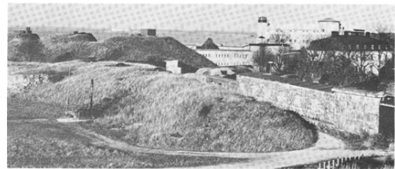
Bild 33. 57 mm snabbeldsbatteriets tre pansarkupoler finns ännu kvar i vällen framför linje III.

I övrigt fiskades med ryssjor efter gädda och abborre. Man lade också nät under isen efter strömming, vilket i allmänhet var ett mycket kallt arbete. Sommartiden ljustrades det friskt efter både ål, gädda och abborre. Om kvällen var lugn, kunde man ofta på sjön i den vackra skärgården se tjoftals eldar. Det var fiskare på jakt efter ål. Det var ju den fisk som betalades häst 80 öre å 1 kr per kg.