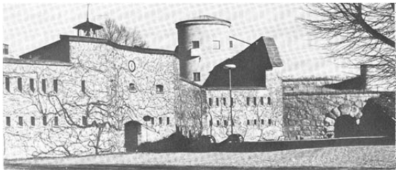
Corps de garde

som gick runt med hjälp av fjäder. Till apparaten hörde fyra hörlurar av samma typ som läkarens stetoskop. Fem öre kostade seansen och gubben höstade säkerligen in många femöringar i synnerhet sådana dagar, när beväringen var ledig. Bio fanns inte. Men min fader, som på alla sätt försökte underhålla beväringen, hade skaffat en skioptikonapparat med ett urval bilder. Resultatet blev dock ganska dåligt på grund av bristen på elljus. Inte ens den kraftigaste fotogenlampa gav tillräckligt ljus.