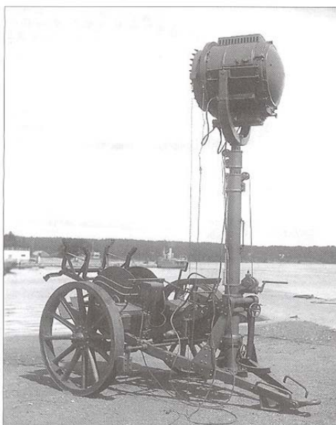
60 cm strålkastare

Vid det snabbskjutande 57 mm batteriet skulle en natt skjutövning äga rum. Målet var en vit vävballong med något mer än en meters diameter. Den bogserades av en ångslup. Denna medförde också ett reservmål på däck, som hastigt skulle kunna anbringas på det bogserade målet. Nu råkade olyckligtvis den skrala